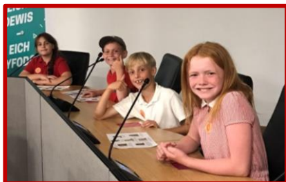
Aelodau'r Cyngor Ysgol yn Senedd Ieuenctid Caerdydd